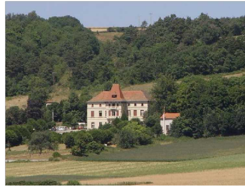
Au cœur du cratère d'Alleret, alt. 650m.